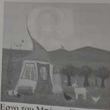
Έργο του Μπάμπη Πυλαρινού